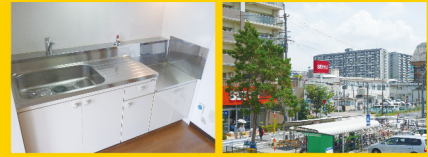
水回りも念入りに清掃してあります。 ベランダより。西友と守山駅がすぐそこです。