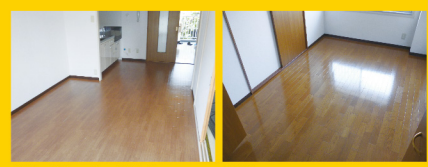
リビングキッチン、造りがしっかりしていて騒音等軽減です。 洋室